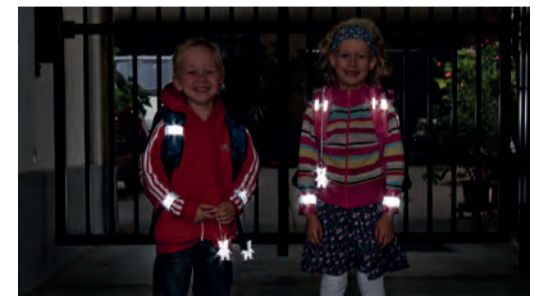
Sicherheit durch Sichtbarkeit!

Sorgen Sie dafür, dass Ihr Kind im Straßenverkehr rechtzeitig gesehen wird. Gerade im Herbst und Winter, wenn es in der Früh noch dunkel ist oder bei nebligem Wetter ist helle Kleidung von Vorteil. Noch besser wirken Reflektoren an Kleidung und Schultaschen – mit diesen können Kinder von Autofahrerinnen und -fahrern schon aus einer Entfernung von 130 Metern wahrgenommen werden.