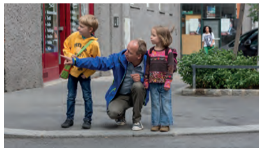
Regelmäßiges, gemeinsames Training ist wichtig!

Gehen Sie mit Ihrem Kind den Schulweg ab und erklären Sie ihm, warum es wo gefährlich ist und worauf es als Fußgängerin bzw. Fußgänger achten muss. Üben Sie problematische Stellen (siehe Schulwegplan) besonders gut. Beim nächsten Mal lassen Sie sich bereits von Ihrem Kind führen, das dabei über sein Verhalten spricht. So können Sie feststellen, ob es alles richtig verstanden hat und eventuell korrigierend eingreifen.